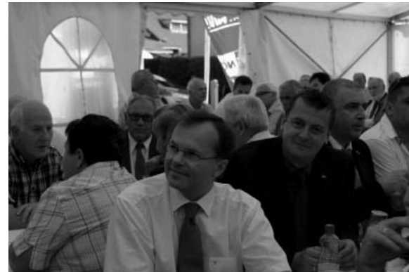
Die Festsitzung vor dem Dämmerchoppen