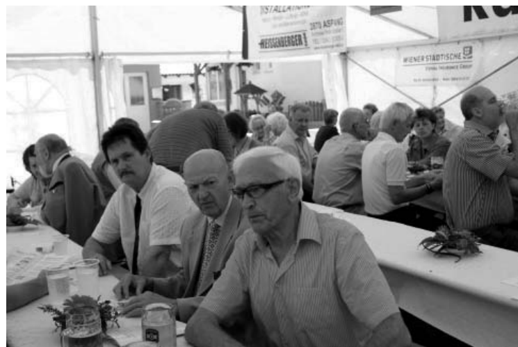
Ein Blick ins Zelt